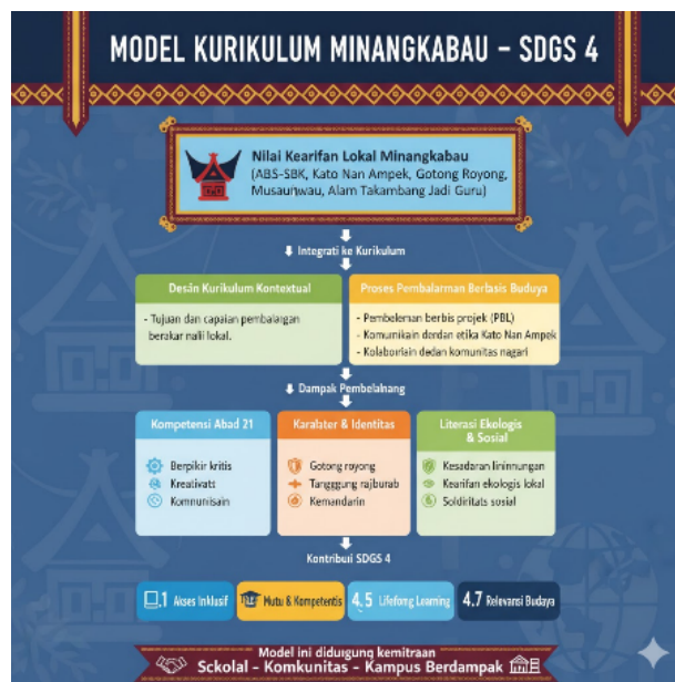
Gambar 2. Model Konseptual Kurikulum Minangkabau–SDGs 4

Model Konseptual Kurikulum Minangkabau–SDGs 4 (Gambar 2) tidak dimaksudkan sebagai hubungan linear yang sederhana, melainkan sebagai kerangka dinamis dan hierarkis. Nilai-nilai budaya Minangkabau ditempatkan sebagai fondasi normatif yang memengaruhi desain kurikulum, mulai dari perumusan tujuan, pemilihan konten, hingga strategi pedagogis dan asesmen. Desain kurikulum kontekstual kemudian berfungsi sebagai mediator yang menjembatani nilai budaya dengan praktik pembelajaran di kelas.